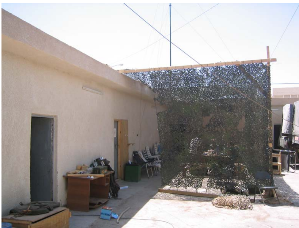
Terras bij het CPA-huis

De waarneming van de elektrische wapenstok werd gedaan vanaf het terras bij het CPA-huis, gelegen tussen het gedeelte met het slaapverblijf, waar zich ook een ondervragingsruimte bevond, en het cellencomplex waar ook de Opsroom was. Het terras was overigens zoveel mogelijk aan het zicht onttrokken door camouflagenetten. Ten tijde van de waarneming was het nog licht.