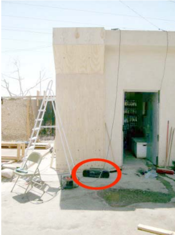
White noise generator: de op de grond staande radio

Het personeel van het FLT ontkennde dat het geluid de ruimten onleefbaar maakte. In de Opsroom , onder hetzelfde dak, was altijd een wacht aanwezig, terwijl gedetineerden in het gebouw waren. Bovendien stond er een radio waarmee de eigen militaire verbindingen werden beluisterd. De FLT-ers zelf ondervonden er in elk geval niet veel hinder van en ook in het nabij gelegen slaapverblijf of op het terras buiten, dat als eetruimte en verblijf diende, zei niemand er hinder van te hebben. Overigens had een lid van het CIV-team tijdens de gesprekken wel eens gevraagd of de radio kon worden afgezet, omdat zij anders geen normaal gesprek konden voeren. Maar de verhoorruimte lag dan ook aan de gang waar de white noise werd gegenereerd en de deur van de verhoorruimte had een open tralievenster. De commandant van het FLT meende dat de toepassing van white noise om veiligheidsredenen noodzakelijk was. De ruis kon dag en nacht doorgaan en deze commandant erkende tegen de Commissie dat het voor de gedetineerden moeilijk moest zijn geweest om te slapen. De Britse Captain verklaarde tegenover de Commissie dat de leden van het CIV-team haar hadden verteld dat white noise werd gebruikt om onderlinge communicatie tussen gedetineerden te verhinderen en om hen uit de slaap te houden.